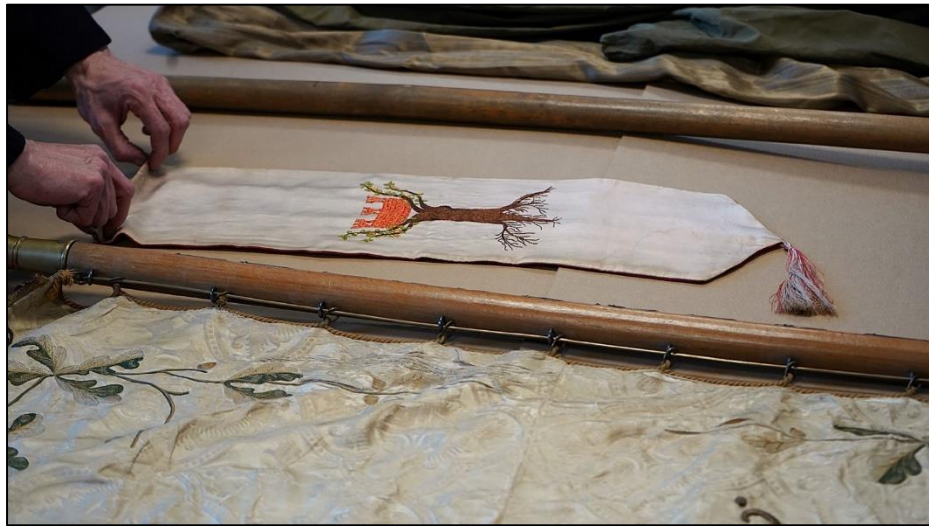
Fot. 3 i 4. Elementy uzupełniające sztandaru Koła Śpiewackiego „Lutnia”. Chorągiewka z herbem Międzychodu i napisem „Nagroda Magistratu Międzychód na Zjazd Śpiewaczy w Międzychodzie dnia 6.IX.1936 r.”.