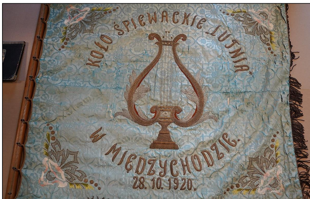
Fot. 1 i 2. Awers i rewers sztandaru chóru „Lutnia”.