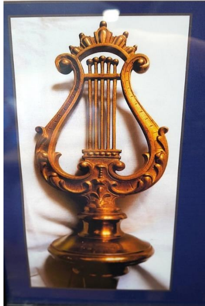
Fot. 5. Element uzupełniający sztandaru Koła Śpiewackiego „Lutnia”. Sygnaturka lutni, wieńcząca drzewiec sztandaru. Na drzewcu umieszczono także gwoździe z nazwiskami fundatorów sztandaru.